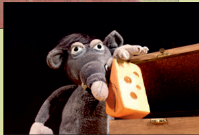
Krallenkalle baut 'ne Falle.