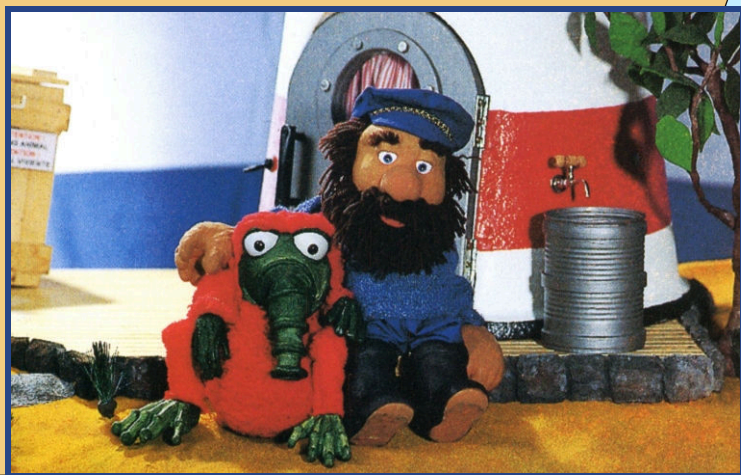
Der Hüpfier und sein Freund

“Es kam aus Übersee” ist ein Figurentheater über die Annäherung zweier sehr unterschiedlicher Lebewesen- gespielt mit Tischfiguren und Musik. Wer sehen möchte, wie die beiden doch noch Freunde wurden und warum der Hüpfier vom alten Mathiessen unbedingt das Segeln lernen wollte, der sollte gucken kommen.